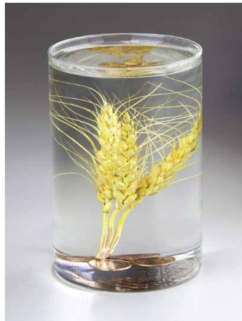
Encapsulation par l'équipe de recherche et développement d'Ecopoxy

Surfaces recommandées : bois, métal, béton, granit, cuivre, acier inoxydable, matériau stratifié, Formica, bambou, cuir, céramique, fibre de verre, plastique, roche, œuvre d'art, photographie, coquillage, tissu, papier, plante séchée et beaucoup d'autres encore.